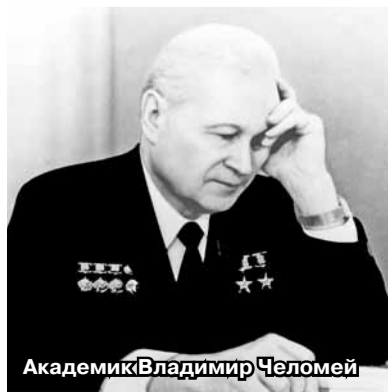
Академик Владимир Челомей

Торжественное мероприятие проходило в подмосковном наукограде Реутов в Деловом комплексе Военно-промышленной корпорации «НПО машиностроения». Создателем и руководителем этого предприятия российской космической отрасли был академик В.Н. Челомей.